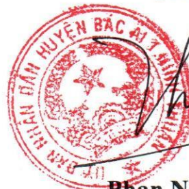
Phan Ninh Thuận